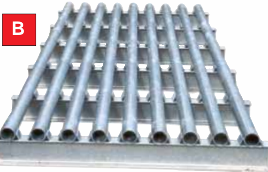
ERPP16 / ERPP17

Ermöglicht die freie Zufahrt aller Fahrzeuge bei gleichzeitigem Zurückhalten der Tiere. Montagefertig auf dem Boden einer Kluft (Umrandung auffüllen), für alle Zuchttiere geeignet (Schafe, Rinder, ...) und andere (Wildschweine, Rehe, ...) Als Option, seitlicher Gatter, Gesamthöhe 1,35 m / Höhe ab Boden 1.10 m.