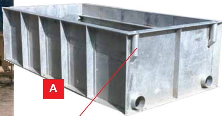
Pfostenhalter ERPP42 Standard