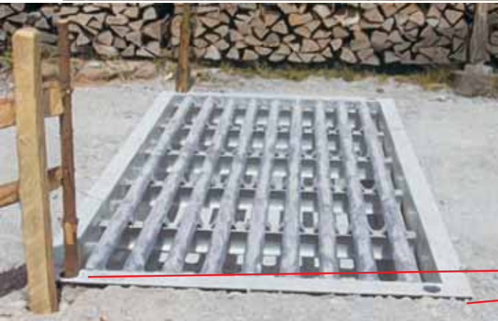
ERPP40 / ERPP41