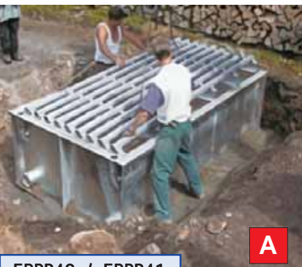
ERPP40 / ERPP41

Ermöglicht die freie Zufahrt aller Fahrzeuge bei gleichzeitigem Zurückhalten der Tiere. Montagefertig auf dem Boden einer Kluft (Umrandung auffüllen), für alle Zuchttiere geeignet (Schafe, Rinder, ...) und andere (Wildschweine, Rehe, ...) Als Option, seitlicher Gatter, Gesamthöhe 1,35 m / Höhe ab Boden 1.10 m.